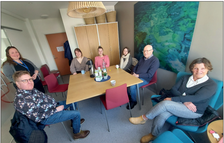
Den 22. mars besøkte Brukerutvalget Vardesenteret hvor de fikk omvisning og presentasjon.