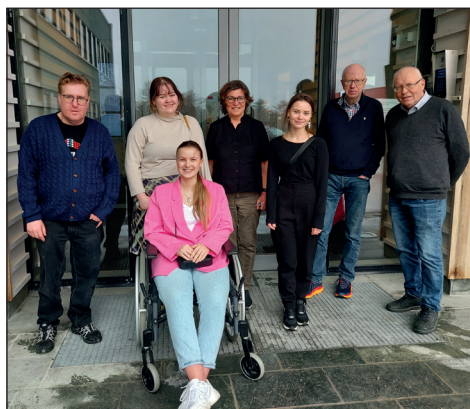
Brukerutvalget samlet i Lofoten.