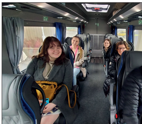
Brukerutvalget ble hentet på flyplassen av pasientreiser sin buss.